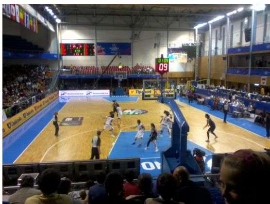
Mistrovství světa v basketbalu žen 2010